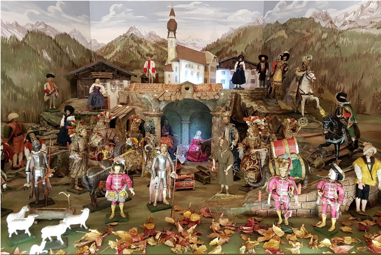
Vue de la partie centrale de la crèche