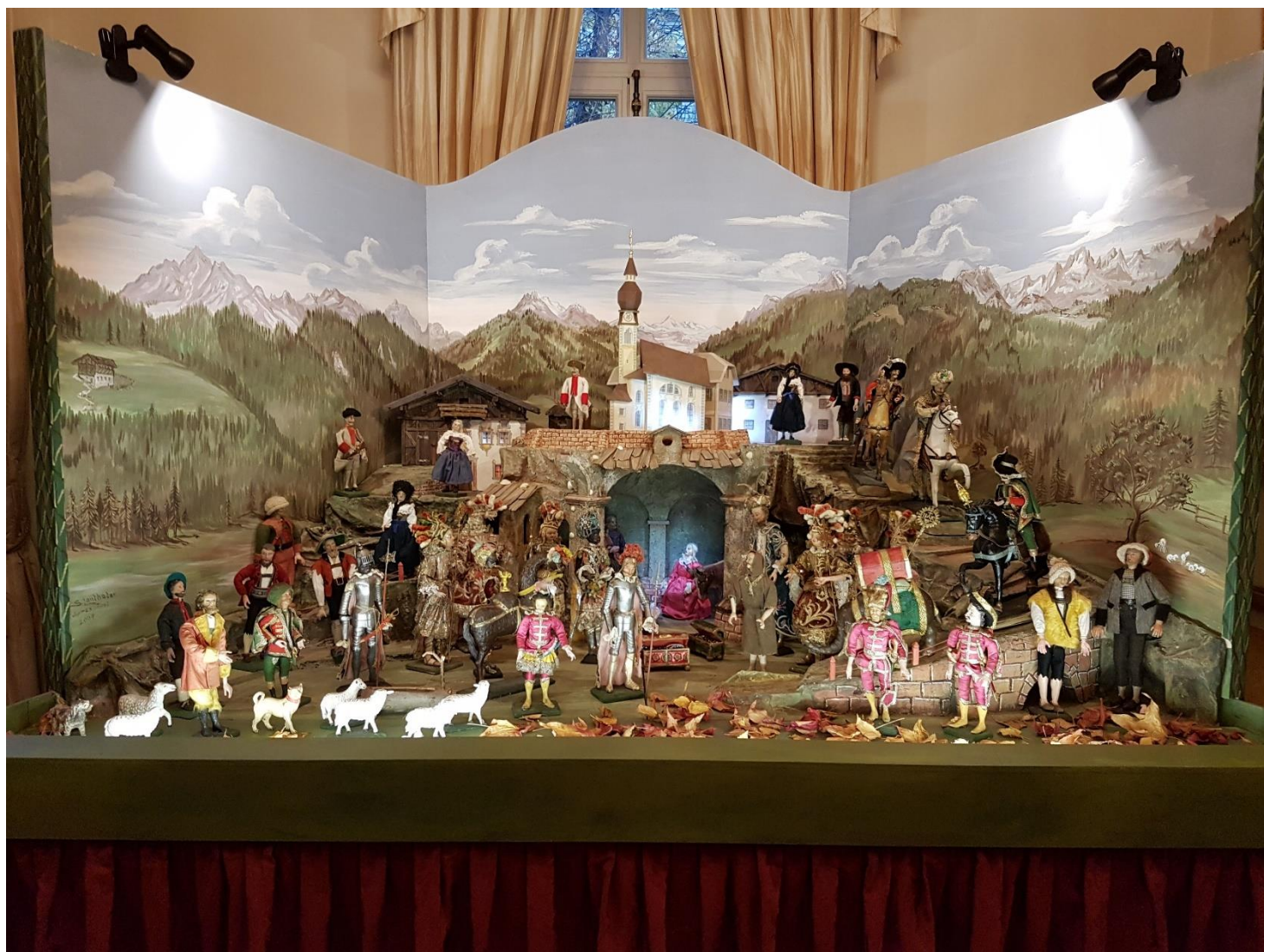
Vue d'ensemble : la crèche dans le salon de l'ambassade d'Autriche à Paris – déc 2020

Été 2020 : un éclairage LED a été installé dans la grotte et certaines maisons. Les éléments de la scène ont été rénovés et adaptés pour réduire le volume de stockage de certains et les garder tous en sécurité dans des solides caisses en bois.