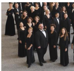
Le Chœur de Radio France

Radio France organise une série de concerts intitulée "Chorus Line" où des œuvres vocales sont mises en avant.