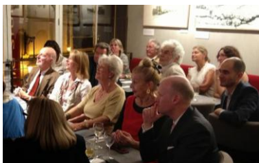
Membres de l'AAP